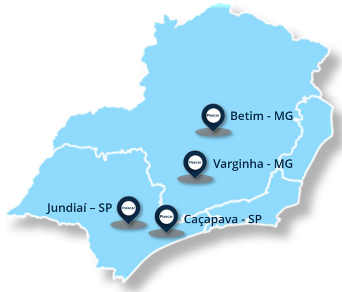
Imagem 1: Unidades produtivas da Plascar.

Atualmente, a Plascar conta com quatro unidades produtivas estrategicamente localizadas para atender aos principais polos automotivos do Brasil: Jundiaí (SP), Betim (MG), Varginha (MG) e Caçapava (SP), além de duas unidades de negócios, nas cidades de São Bernardo do Campo (SP) e São José dos Pinhais (PR).